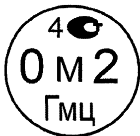
Рисунок 4.2. Знак поверки государственного научного метрологического института