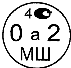
Рисунок 4.1. Знак поверки государственного регионального центра метрологии