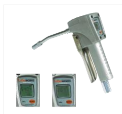
Электронный расходомер (опция)

Пневмонасос 50:1, крышка, пистолет без счётчика (опционально пистолет с электронным расходомером), шланг 1,5м , ёмкость с загрузкой 13кг., мембрана ,